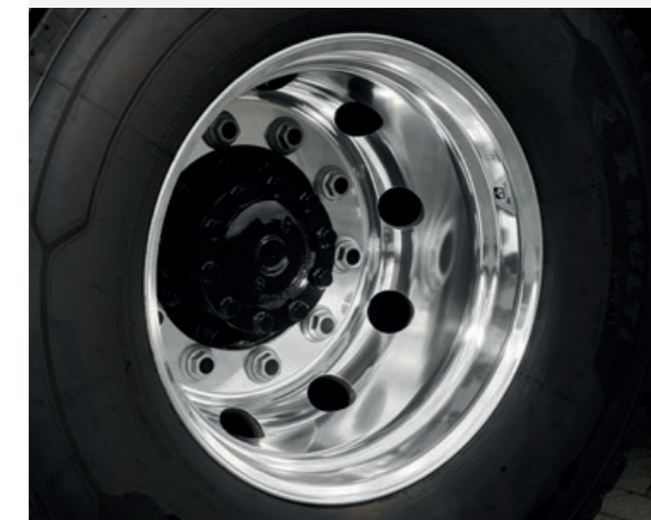
Μετά τον καθαρισμό